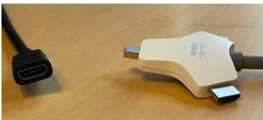
Afbeelding: Links de HDMI-contrastekker Rechts de Multihead-kabel

Eigen device aansluiten via de kabel: de Multihead-kabel (zie onderstaande afbeelding) ligt los in de ruimte of is aangesloten aan de achterkant van het scherm op bij de kiosk-pc. Deze kabel kun je gebruiken om je eigen device aan te sluiten op het Webex-bord.