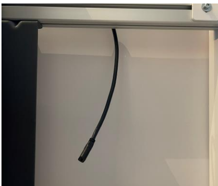
Afbeelding: locatie HDMI-contrastekker

Druk op Schermdelen 3 , daarna op Kabel en vervolgens op In oproep delen. Wil je stoppen met delen? Raak dan opnieuw het scherm aan. Linksboven op het scherm verschijnt de optie Delen stoppen . Druk hierop om het scherm delen te beëindigen.