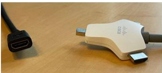
Afbeelding: Links de HDMI-contrastekker Rechts de Multihead-kabel

Eigen device aansluiten via de kabel: de Multihead-kabel (zie onderstaande afbeelding) ligt los in de ruimte of is aangesloten aan de achterkant van het scherm op bij de kiosk-pc. Deze kabel kun je gebruiken om je eigen device aan te sluiten op het Webex-bord.