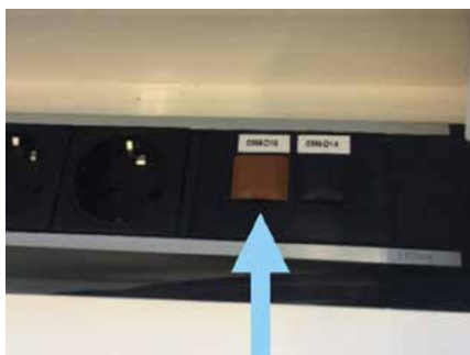
Afbeelding 2 (BZ-netwerk)

Op de aanlandplekken zijn ook twee netwerken beschikbaar. De bruine ingang is voor het BZ-netwerk, zie afbeelding 2. De zwarte ingang is voor lenM, COA, IND en DT&V.