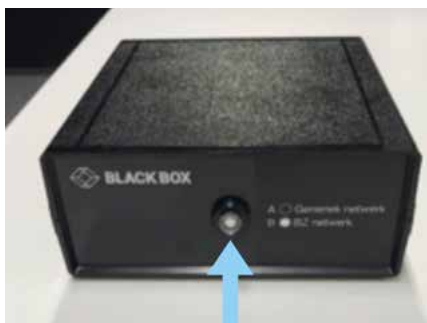
Afbeelding 1 (BZ-netwerk, de knop indrukken, witte punt)

Voor ambtenaren van het ministerie van Buitenlandse Zaken (BZ) is een extra beveiligd netwerk beschikbaar. Dit netwerk is beschikbaar in het voorkeursgebied van BZ (verdieping 6 t/m 8), lenM (verdieping 9 t/m 12) en op de 16e etage. Het schakelen tussen het generieke netwerk en het BZ-netwerk kan met de knop op de netwerkschakelaar (Black Box), die op de bureaus staan, zie afbeelding 1.